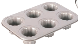
⑧フッ素加工 カヌレ天板